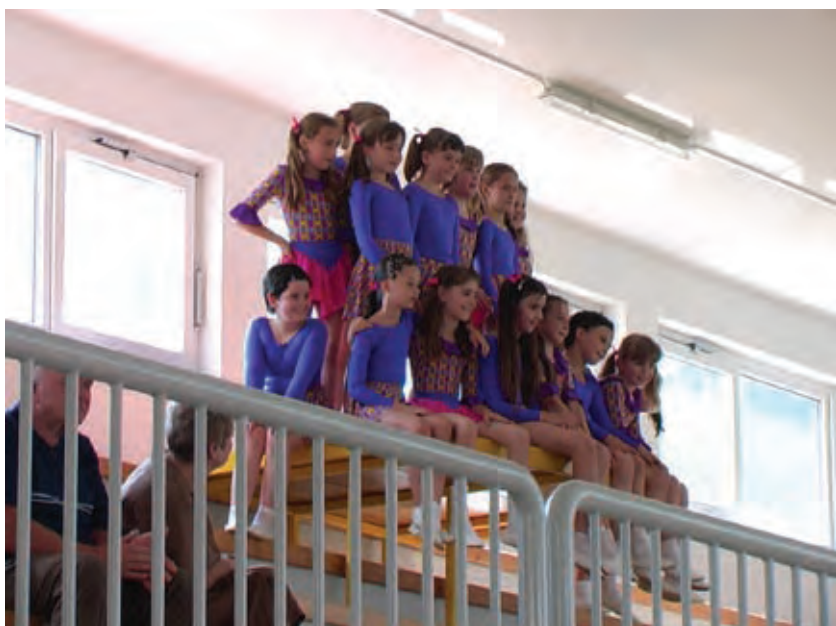
Tudi druge je lepo gledati