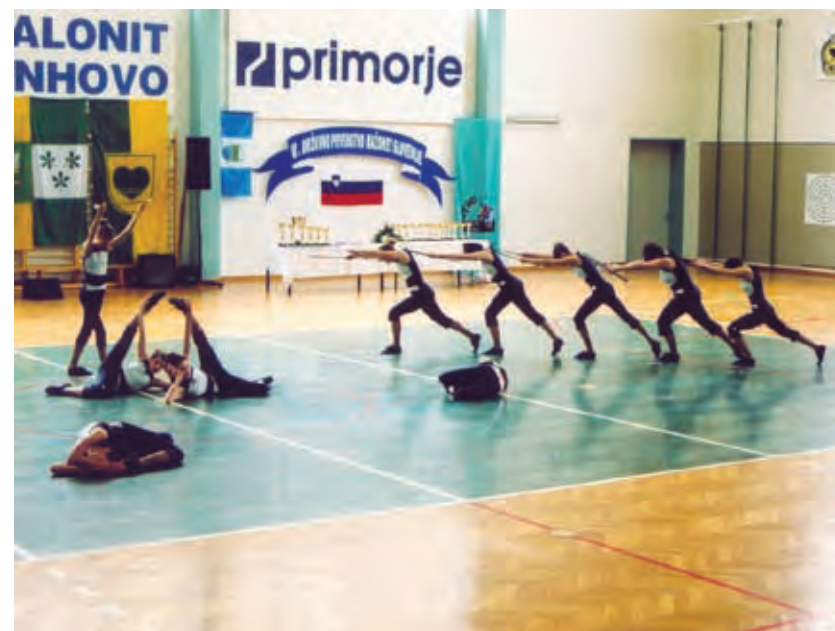
V. državno prvenstvo v Kanalu