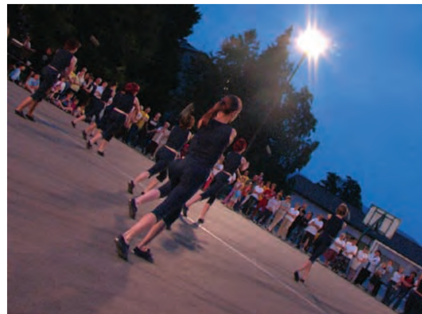
Najbolje odplesana "Metallica"