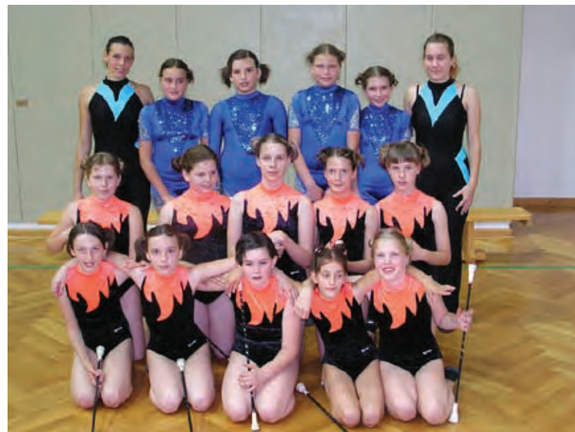
Skupinska slika III generacije