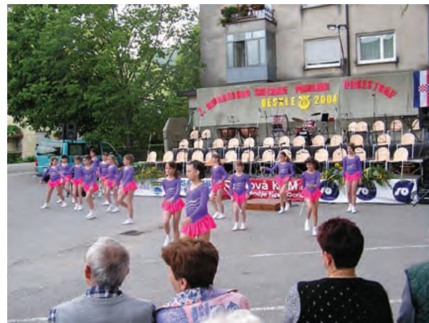
Tudi z orkestri se družimo