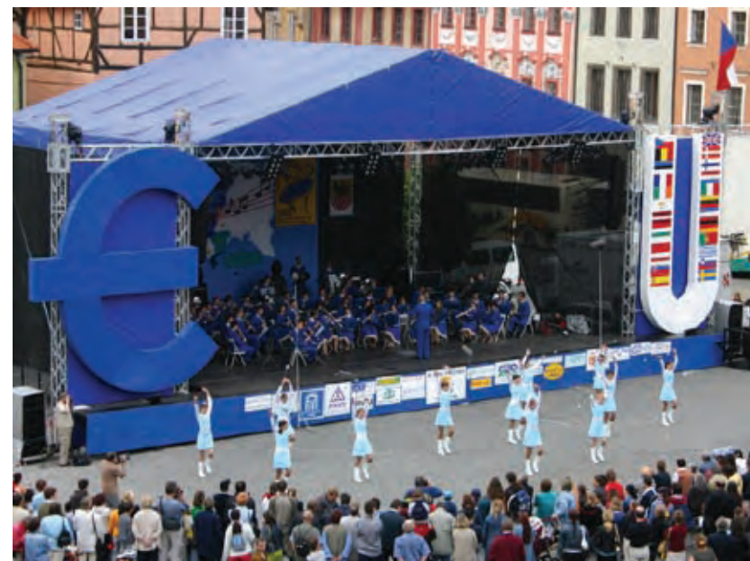
Cheb na Češkem