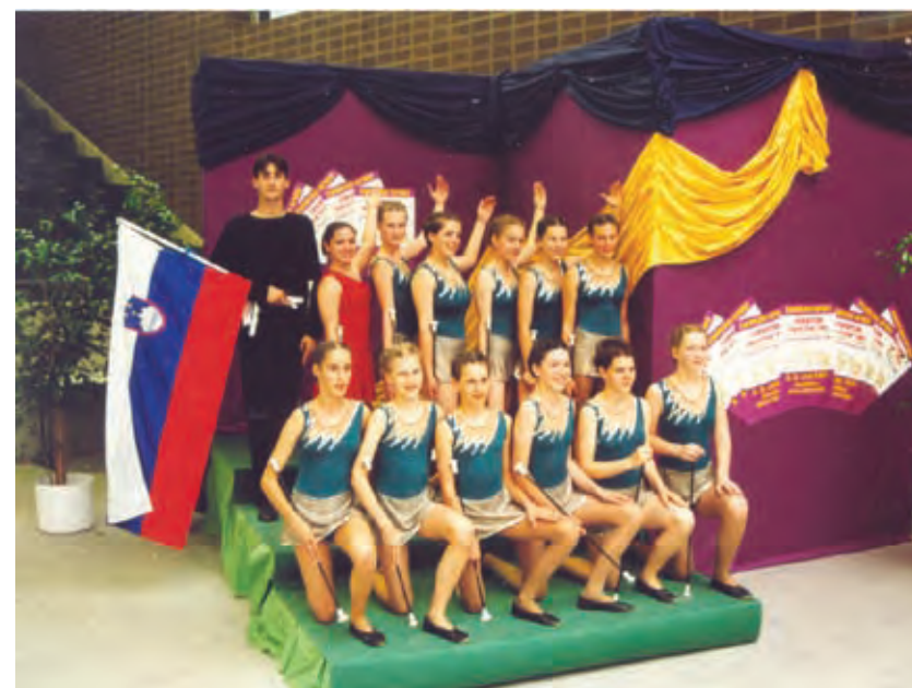
Evropski pokal v Nemčiji