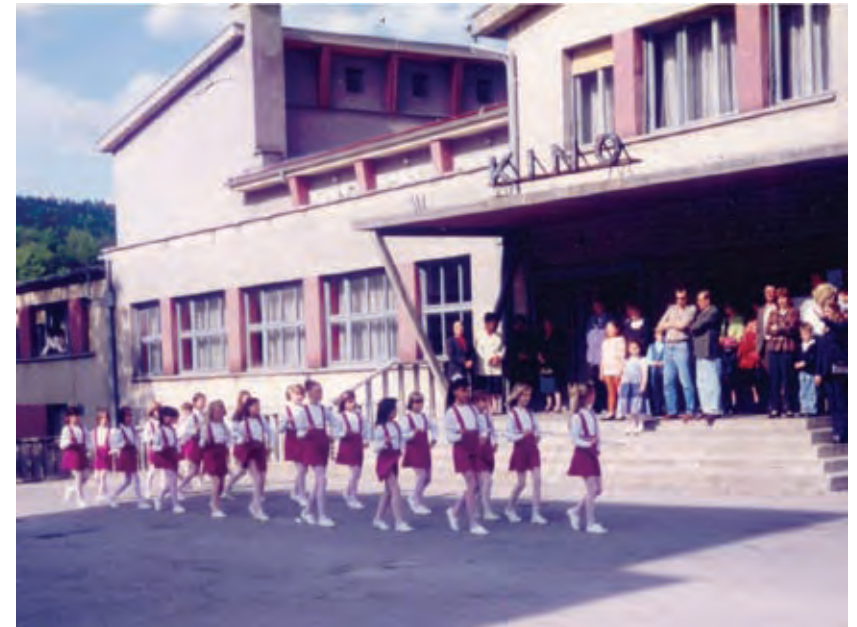
Parade so se vrstile