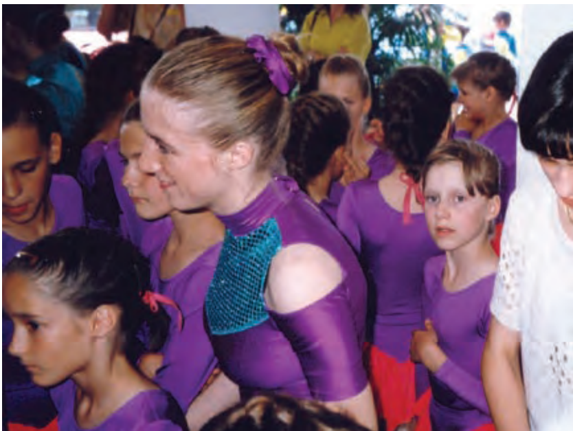
Zadnje Arijanino tekmovanje

O tem, zakaj so članice twirling skupine, so razmišljala dekleta, ki že peto oz. šesto leto vztrajajo in pridno vadijo, nastopajo in tudi že tekmujejo.