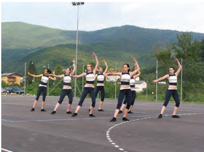
Otvoritev ŠRC Ložice