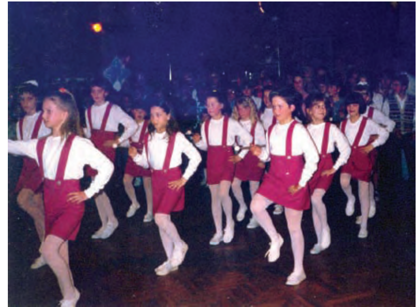
Vsak začetek je težak