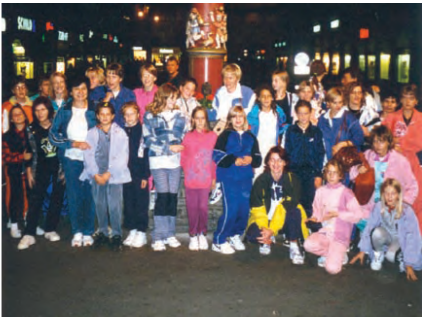
S starši v Bernu (Švica)