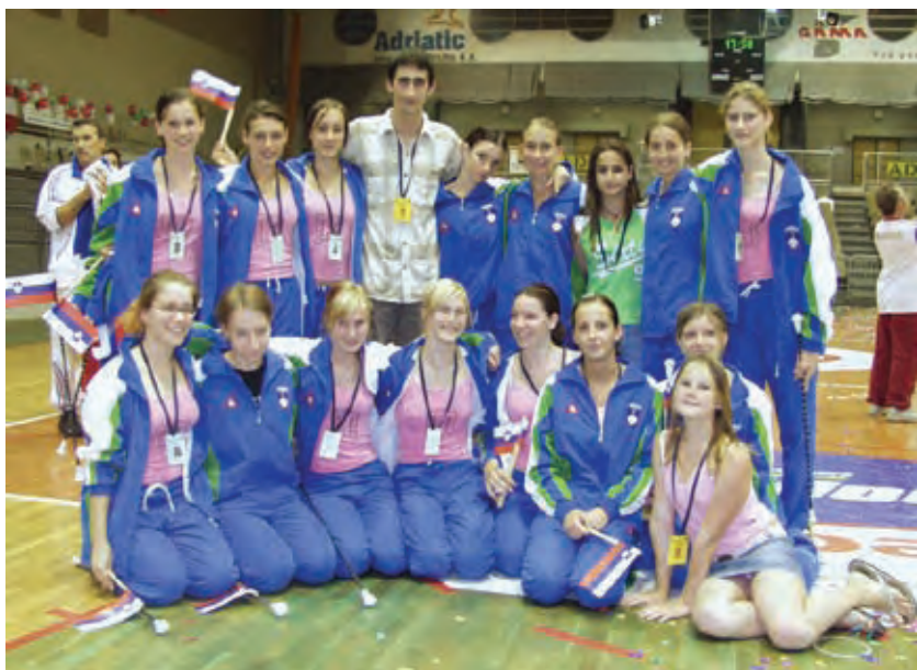
Evropsko prvenstvo v Mariboru