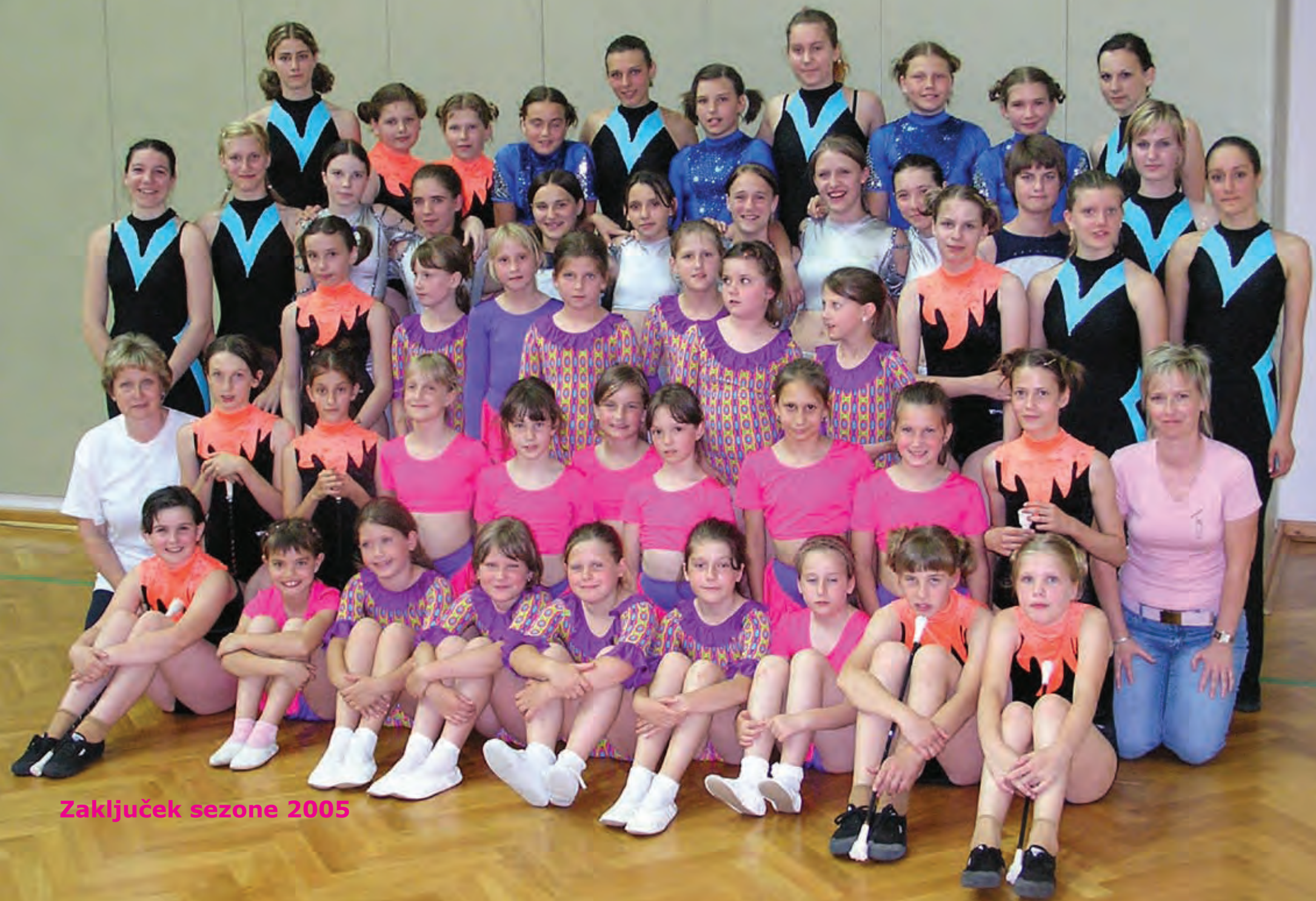
Zaključek sezone 2005