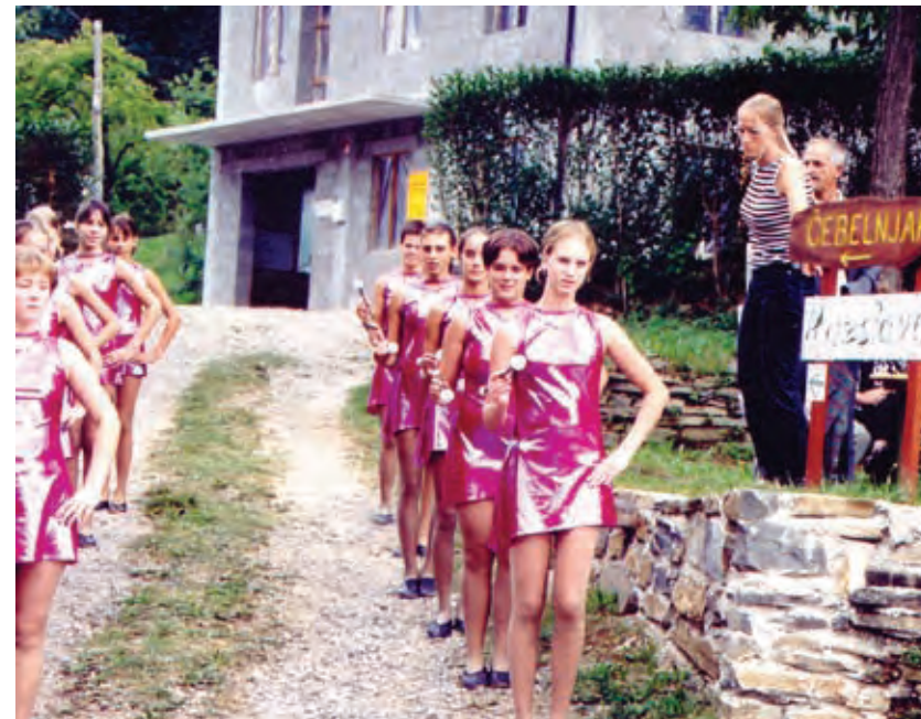
Praznik medu v Britofu