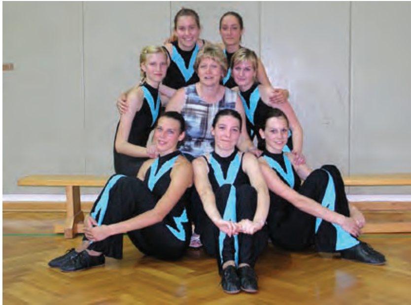
Vztrajamo 10 let