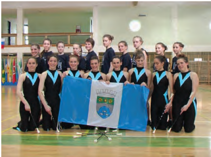
Slika za sponzorja